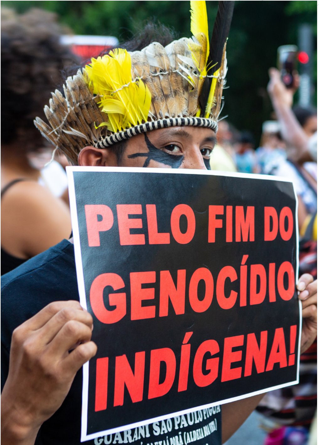
Hombre Indígena manifestándose en Brasil.