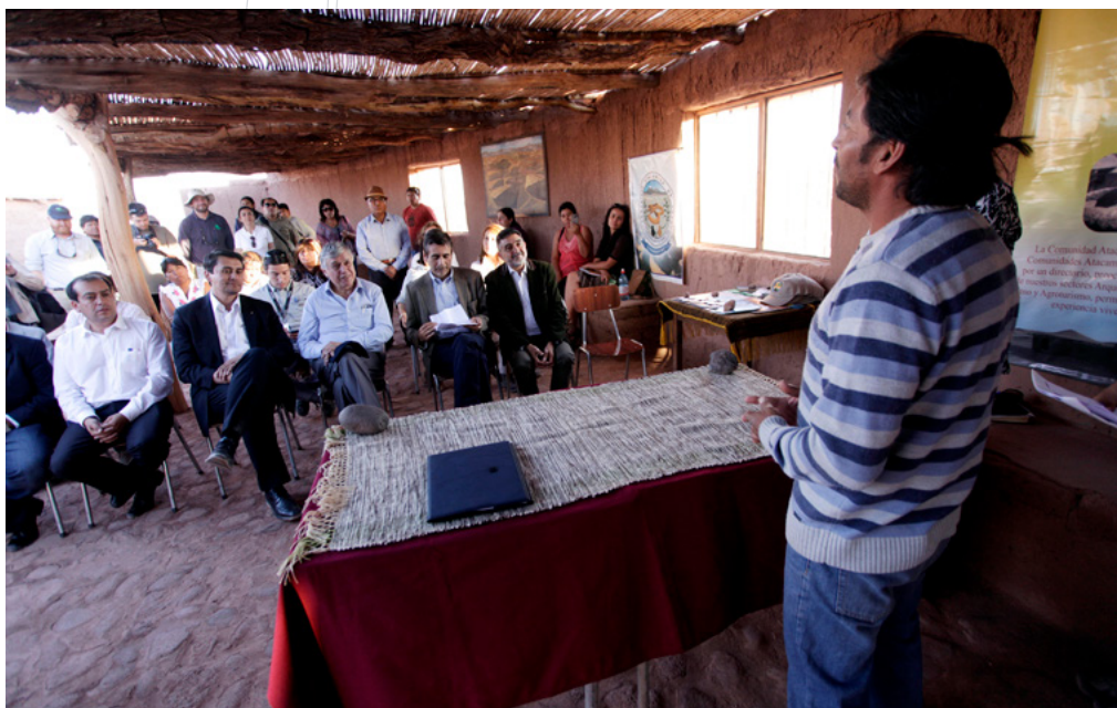
Reunión entre autoridades estatales y comunidades indígenas, Chile