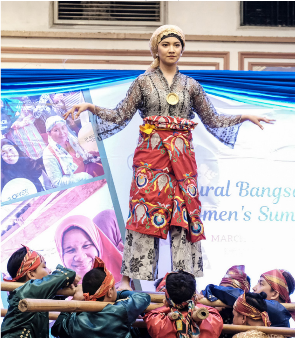
Evento de la ONU Mujeres sobre las comunidades indígenas en Bangsamoro, Filipinas. Josef Dumbrique.