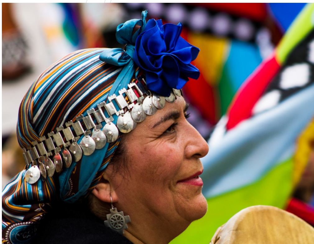
Mujer Mapuche. Phil Brown