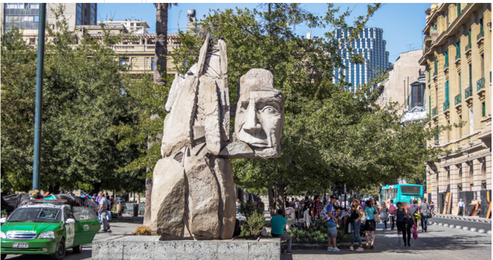
Monumento a los pueblos indígenas en la Plaza de Armas, Chile.