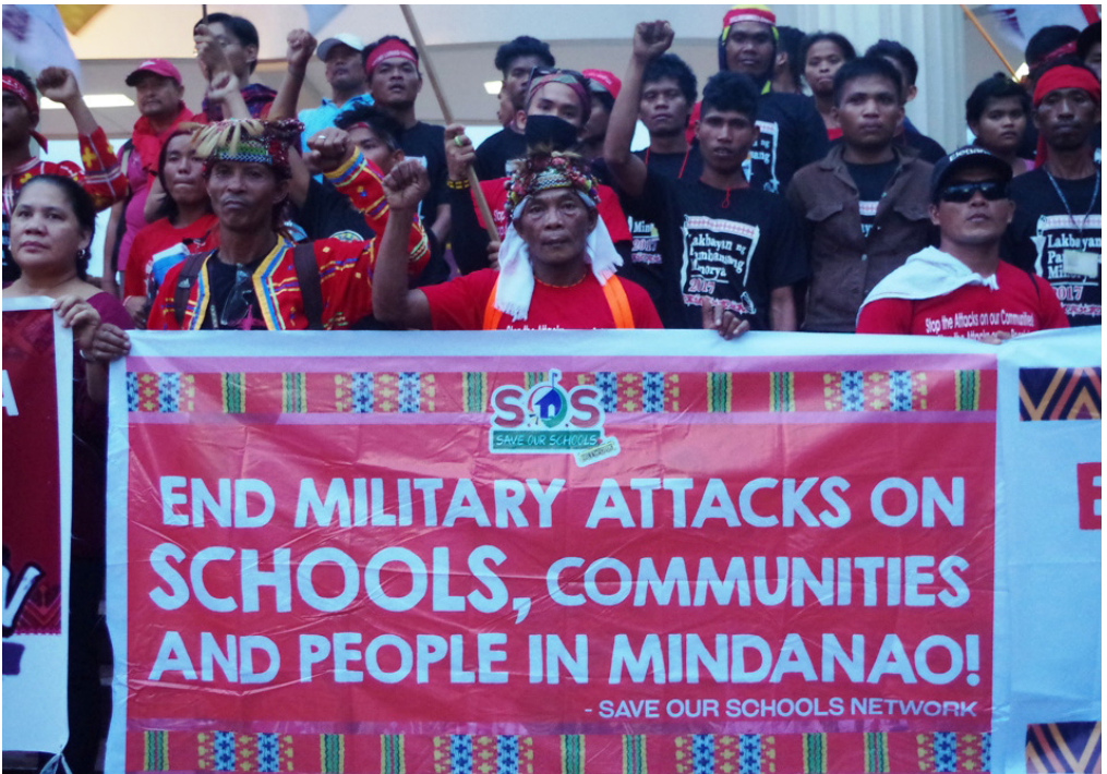
Personas de la comunidad Moro protestando, Filipinas