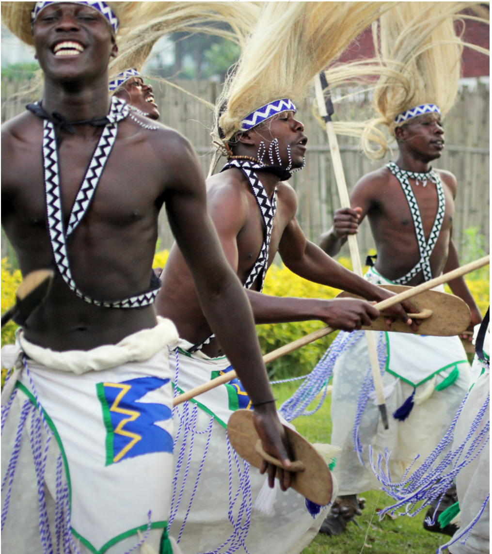
Hombres Batwa interpretan la danza tradicional Intore en Musanze, Ruanda.