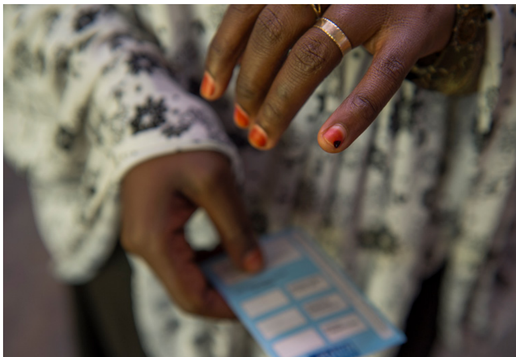
Mujer indígena votando la constitución, Ruanda.