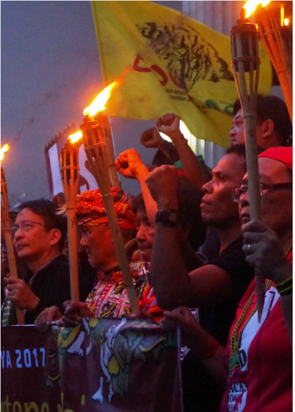
Activistas indígena protestando en Filipinas. Fred Dabu