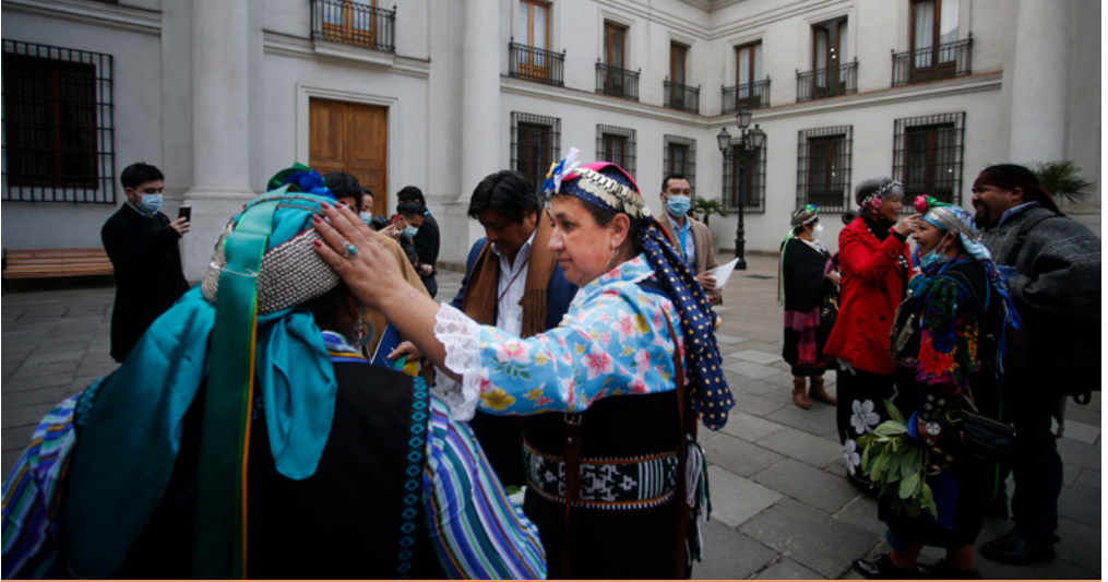
Reunión entre las autoridades estatales y las comunidades indígenas en la Subsecretaría de Activos Nacionales de Chile