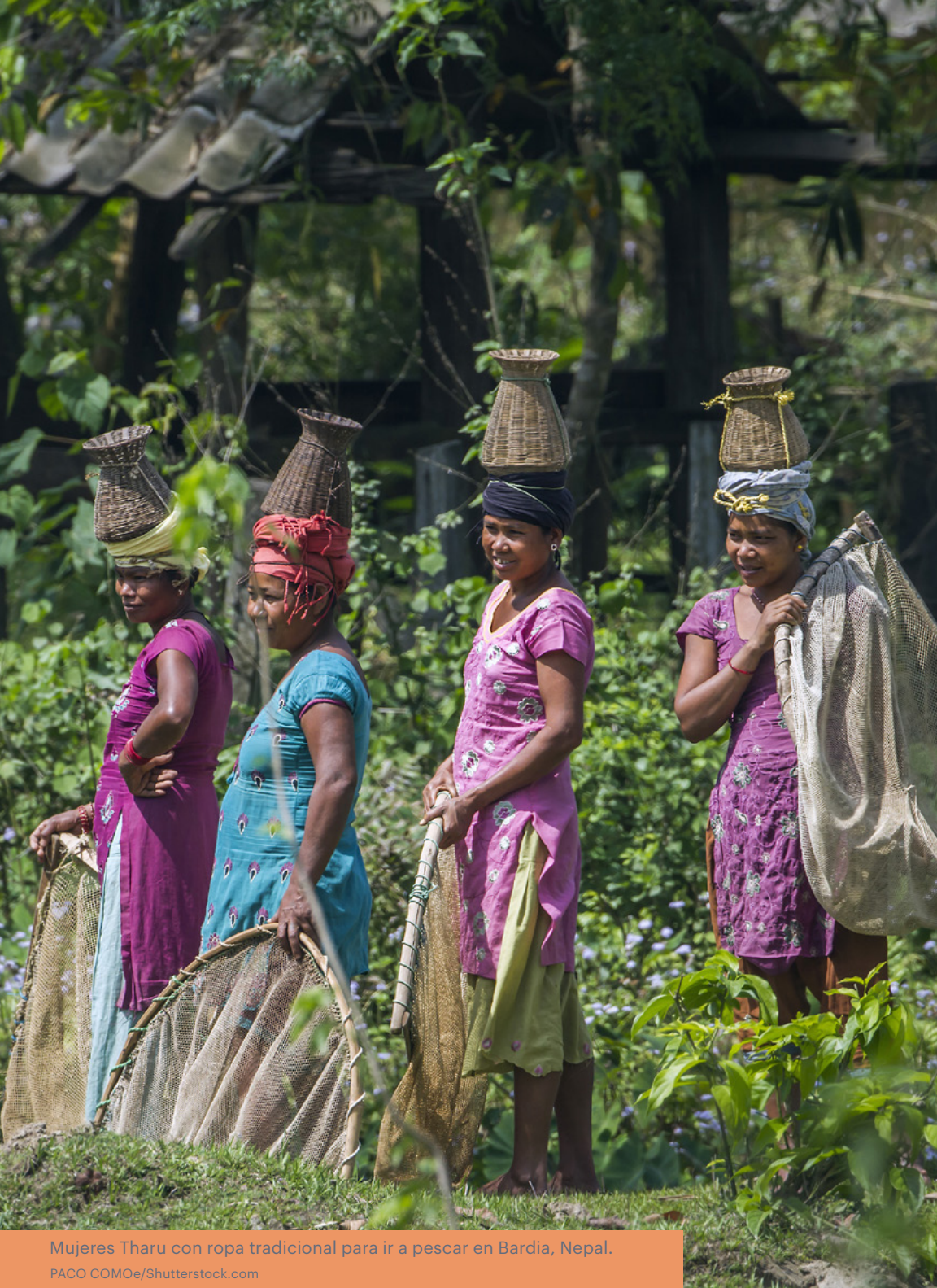
Mujeres Tharu con ropa tradicional para ir a pescar en Bardia, Nepal.