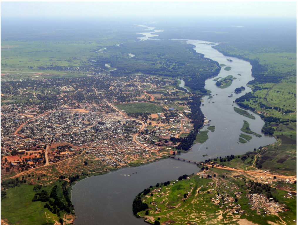
Vista aérea, Sudán del Sur.