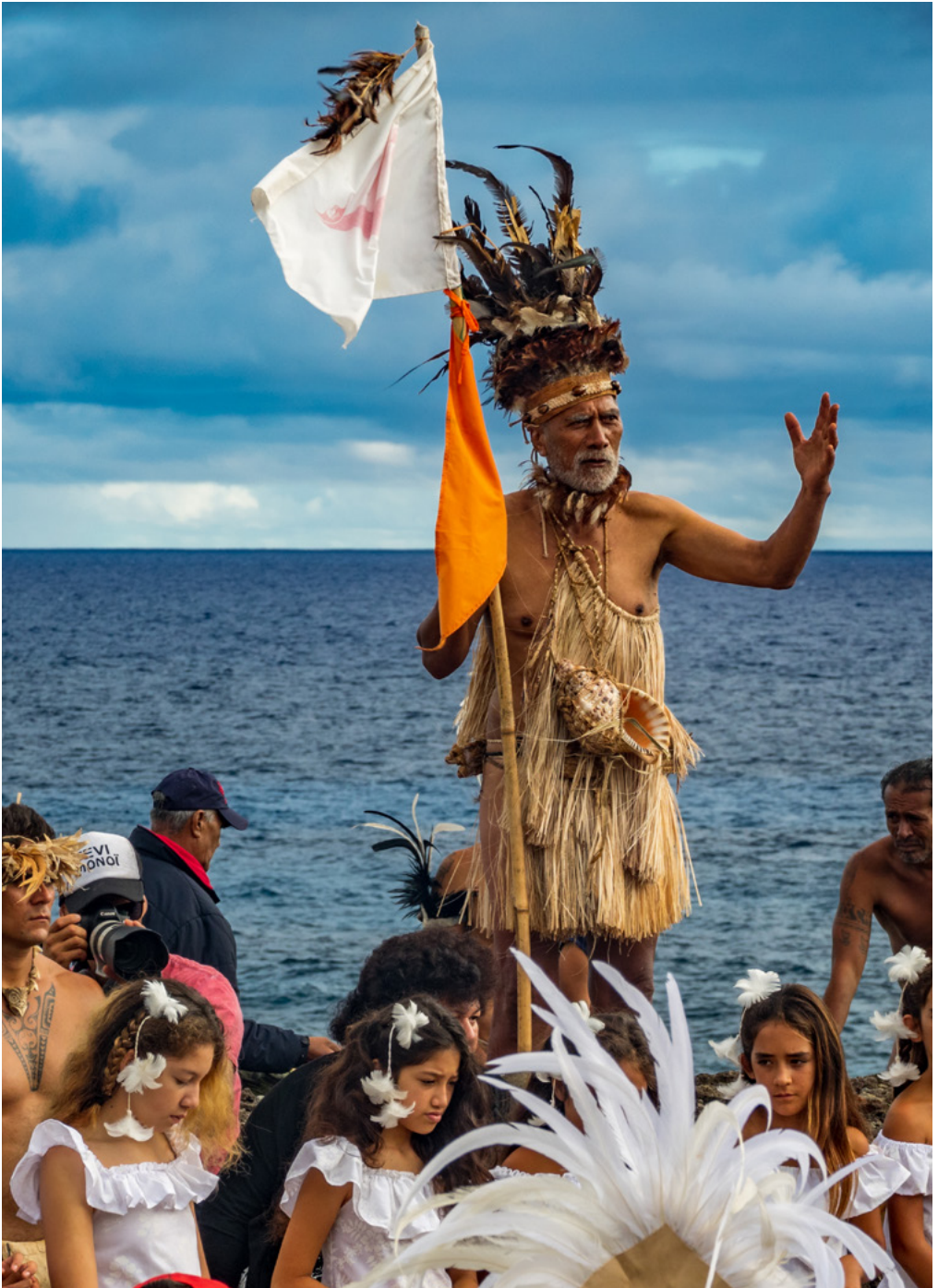
El líder de la isla da un discurso en la recepción del bote histórico que llega a Anakena después de navegar desde el continente emulando un viaje antiguo, Rapa Nui, Chile.