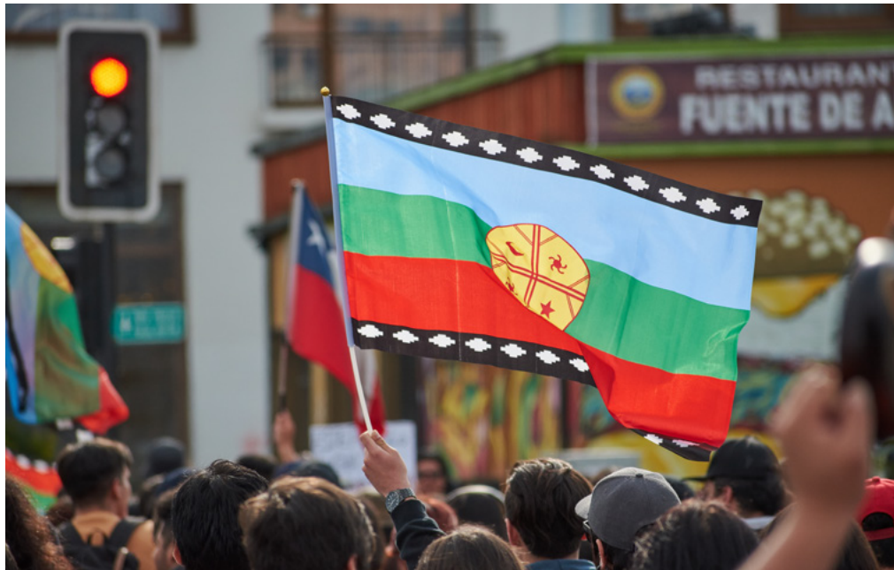
Manifstantes con banderas Chilenas y Mapuches en Puerto Montt, Chile.

Por otro lado, la propia situación de los pueblos indígenas se construye a partir de la historia de violencias de la colonización y sus consecuencias en el largo plazo - la colonialidad -, constitutivas de vulneraciones a derechos colectivos y de los derechos individuales de sus miembros, por sí mismos significan una deuda que debe ser reparada.